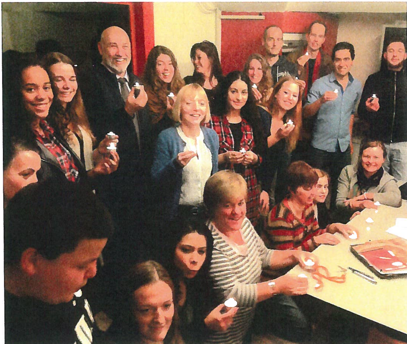
een deel van het INLIA-team