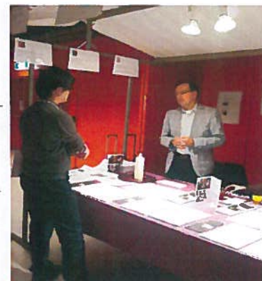
Voorlichting van KRP

INLIA heeft verder op uitnodiging van een aantal geloofsgemeenschappen en andere organisaties voorlichting gegeven over haar werkzaamheden. Ruim 30 maal is vanuit INLIA voorlichting verzorgd. Zo werden bijv. Engelstalige gastcolleges gegeven aan studenten van de Minor International Aid & Development aan de Hanzehogeschool en was INLIA, net als vorig jaar, vertegenwoordigd tijdens de Landelijke Diakonale Dag van Kerk in Actie in de Jaarbeurs in Utrecht. Mediavorlichting door de directie.