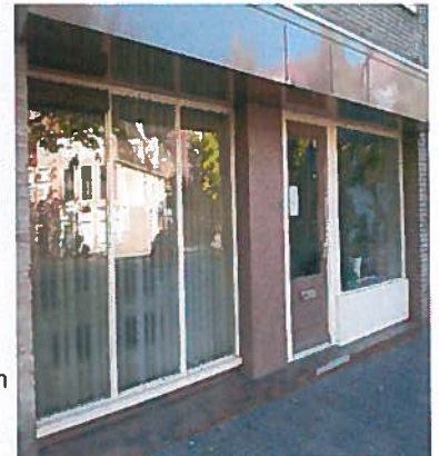
Kantoor en werkruimte Transithuis

Medio 2012 is door subsidie van het ministerie aan KiA aangevangen met de uitbreiding van het project. In Groningen waar het project wordt uitgevoerd door de stichting INLIA, is een kantoor, zijn er twee werkruimten en zijn 6 woningen ingericht.