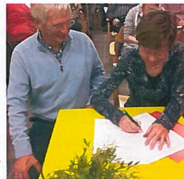
Ondertekening Charter in Bodegraven

Na het opheffen van de (provinciale) Stichting INLIA Zeeland bleek er toch behoefte aan structurele en deskundige ondersteuning te zijn. Op initiatief van het Platform Asielzoekers Zeeland i.o. is er in 2012 twee maal uitvoerig met de vertegenwoordigers van het Platform overleg geweest en is er sindsdien regelmatig contact over individuele adviesdossiers.