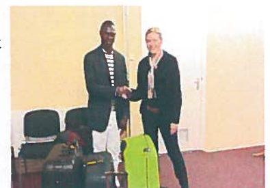
Het vertrek van een TH deelnemer

Er is (verbreding van het) draagvlak gecreëerd voor verantwoorde hervestiging middels de Transithuismethodiek bij organisaties, kerken, vluchtelingenorganisaties en gemeenten.