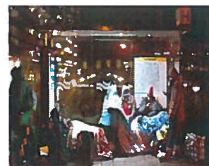
Asielzoekers op straat

Meer dan de 50% van de afgewezen asielzoekers eindigt als gevolg van het rijksbeleid op straat