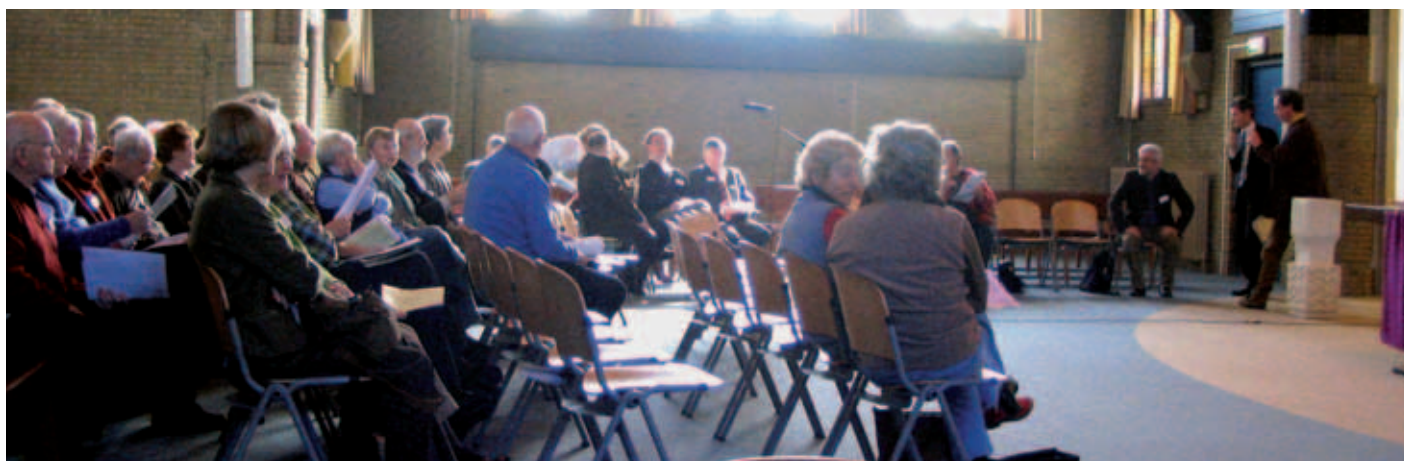
Een workshop die tijdens de landelijke Charterdag wordt gehouden.