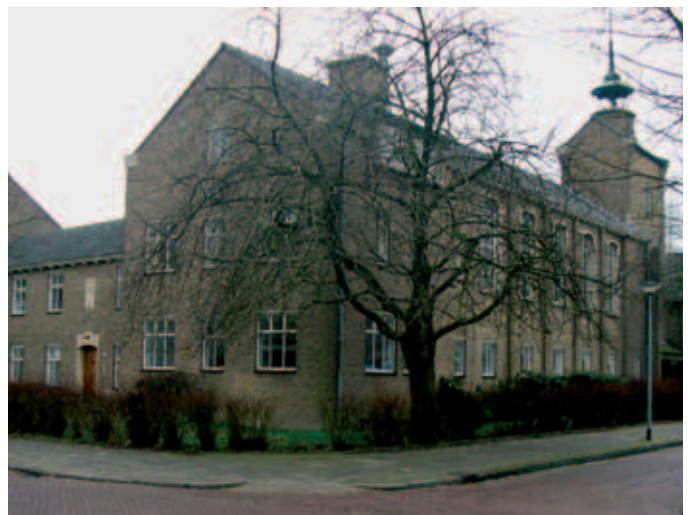
Projectencentrum en Noodopvang Mariënholm aan de Merwedestraat.

In 2003 realiseerde toenmalig Minister Verdonk een beperkte pardonregeling die onvoldoende recht deed aan een toen reeds bestaand maatschappelijk probleem. Samen met Vluchtelingen Organisaties Nederland (VON) hebben we toen al gepleit voor een pardonregeling voor mensen die onder de oude vreemdelingenwet (voor 1 april 2001) asiel aanvroegen in Nederland. In 2007 is deze pardonregeling uiteindelijk tot stand gebracht. INLIA en LOGO hebben een zeer actieve rol vervuld bij de totstandkoming én in de uitvoering van deze pardonregeling. Samen hebben wij onder andere zitting genomen in de zogeheten 'informele expertgroep' van Justitie, waarin verschillende partijen zijn betrokken bij totstandkoming en de begeleiding van de uitvoering van de regeling. Tevens is de website www.pardonnu.nl door INLIA, LOGO en Vluchtelingenwerk tot stand gebracht. Deze site werd maandelijks door tienduizenden bezocht. Op de site is veel gedetailleerde informatie te vinden over de pardonregeling (o.a. een 'Jip-en-Jannekeversie' van de regeling).